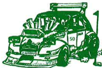
Motor Club Hannutois